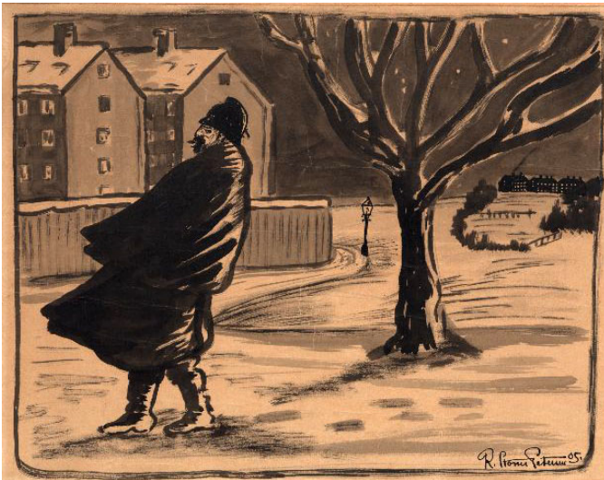
Politibetjentens Juleaften, Politivennen 15.12.1907

Politi og fængselsvæsen var ofte brugte motiver i tidens vittigheder og tegninger. Politimanden kunne bruges som symbolet på loven – og særligt på lovens urimeligheder. Den store tykke panserbasse, der gennempryglede forbryderen, vagabonden eller en tilfældig stakkel, så man ikke kun hos Storm, men i tidens satire i det hele taget. Ordensmagten stod for skud i både ind- og udland. I Danmark gjorde politiets hårdhændede fremfærd under justitsminister P.A. Alberti dem til en oplagt skydeskive for bladtegnere. Politiet blev omtalt som "Ordnungsbanditten", og i mange af Storms satirer er det til diskussion, hvem der er de største banditter - den sultne dreng, der har forbrudt sig mod loven og stjålet en pølse, eller de uniformerede embedsmænd, der holder ham fast. Hele tiden pointeredes et ulige styrkeforhold og betjentene blev karakteriseret med store grove hænder og truende positurer. Storm begyndte pudsigt nok med sine politikarikaturer i politiets eget fagblad, Politivennen i 1905. Tegningerne var her ikke helt så pågående.