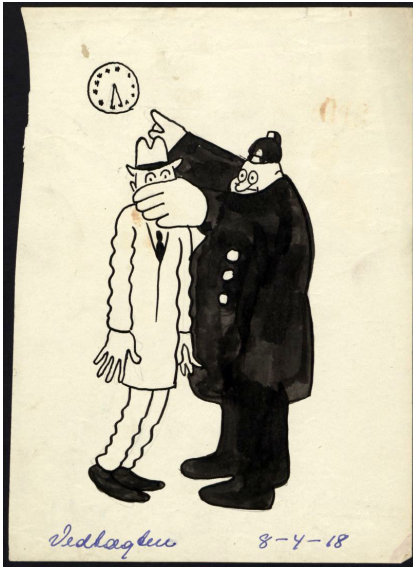
"Vedtægter" 8/4 1918