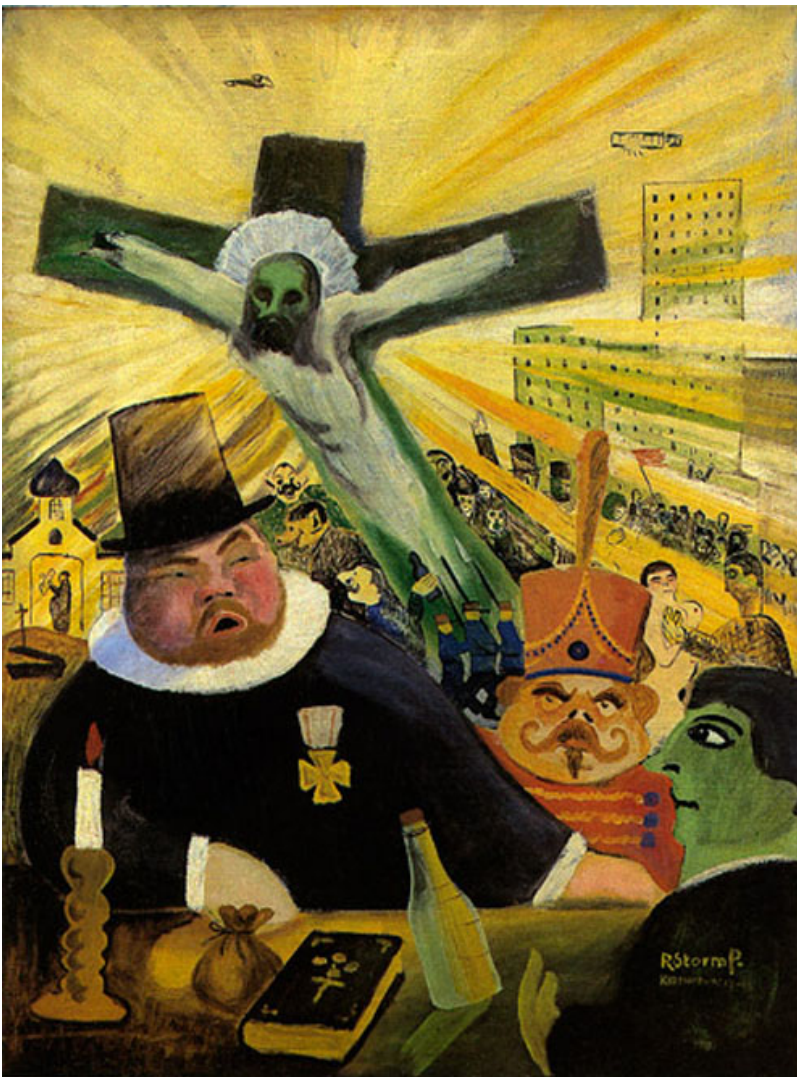
De to kors, 1917-18